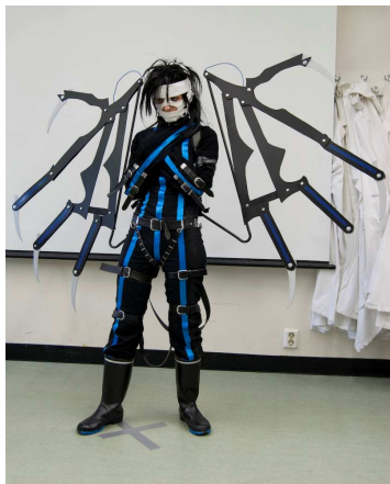
#14 Nero (tuomarit & yleisö, aloittelijat)