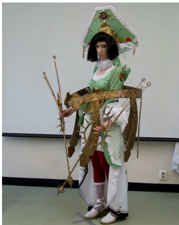
#51 Asagi (yleisöjury, kokeneet)